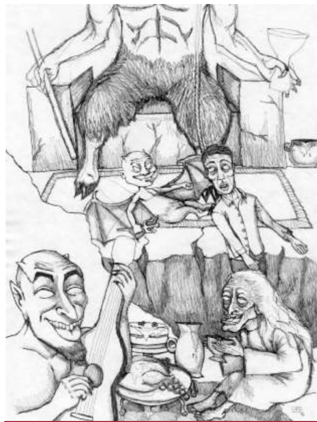
Dibujo - Carmen Ocaranza Zavalía

En las noches suele oírse el estruendo de la