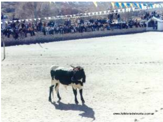
Torito yaguané esperando al torero

Desde temprano arriban desde poblaciones vecinas las procesiones con imágenes de santos (misachicos) y la fiesta comienza con los Amilantes (en algunos casos los denominan Samilantes) y su danza (una de las cuatro danzas colectivas del Folklore Argentino), Las cuarteadoras (varios pares de mujeres llevando media res de cordero seccionada a lo largo, tomadas de las patas) que disputan su parte del animal hasta cortarlo o quitárselo a la contrincante, y tres niños, de los cuales dos hacen de caballo y uno de toro: los primeros simulan perseguir al otro. El sacerdote oficia la misa a